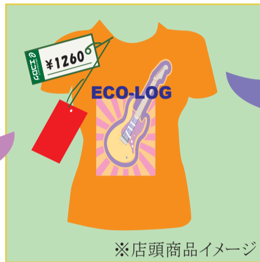
※店頭商品イメージ

通常¥1260の衣類が¥987スタート! ¥735の衣類なら¥525スタートよ!